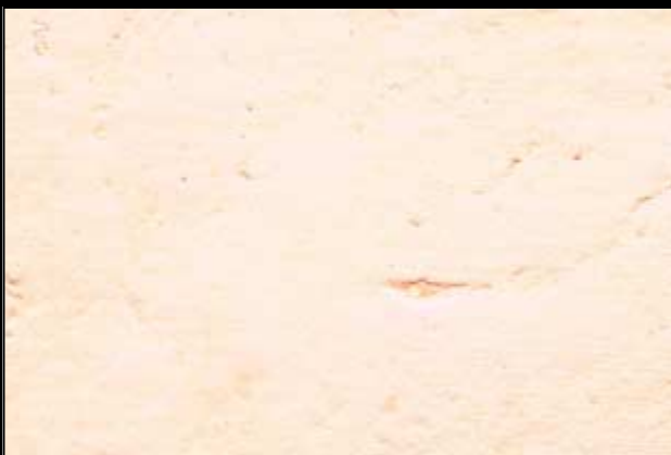
N°419 CANELLE II