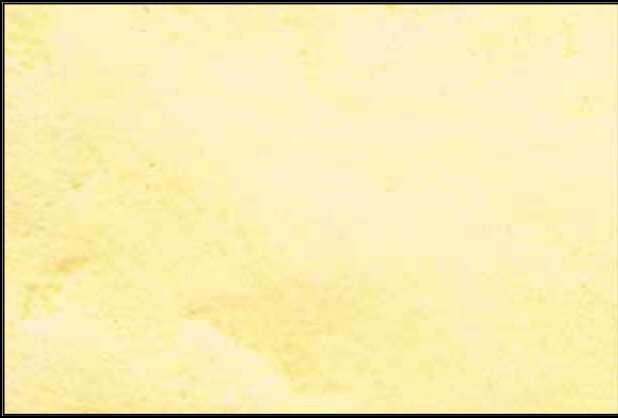
N°416 SANTAL II