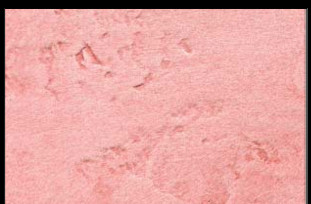
N°421 PAPRIKA II