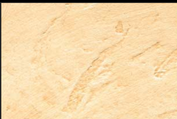
N°420 HAVANE II