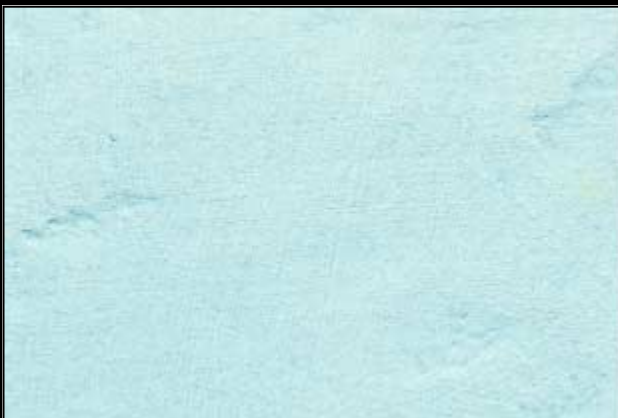
N°417 MURANO II